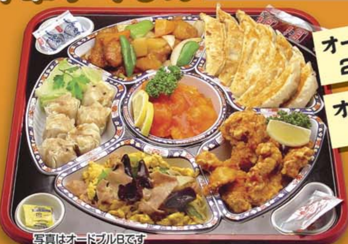
写真はオードブルBです